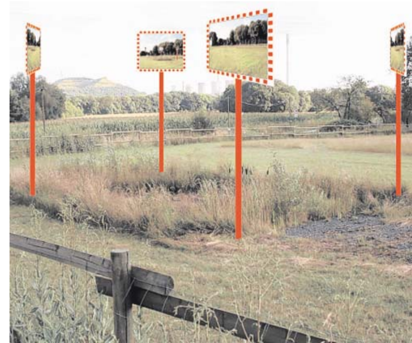
Spiegelungen auf der Ulfkoter Seite der Stadtgrenze zu Gelsenkirchen: „Raumsprachen“.